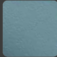
Pastell Blau / Pastel Blue 20290