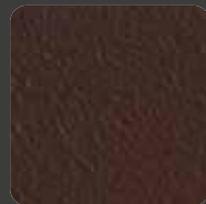
Braun / Brown 20129