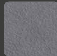
Dunkelgrau / Dark Grey 07432