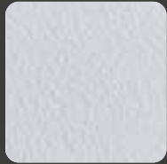
Ferrari-Weiß / Ferrari-White 10120