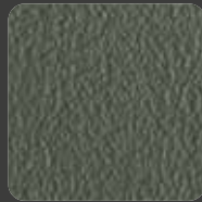
Oliv Grün / Olive Green 20253