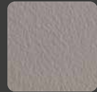
Macchiato 2 20237