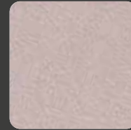
Alt-Rosa / Alto-Pink 20293