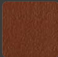
Rotbraun / Reddish Brown 20278