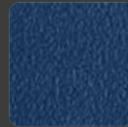
Königsblau / Royal Blue 20284