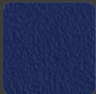
Dunkelblau / Dark Blue 10295