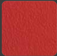
Ferrari-Rot / Ferrari-Red 07478