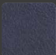
Anthrazit / Anthracite 07445